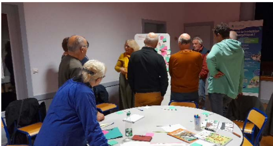
Atelier à L'INEZ

Il n'est pas trop tard pour ceux qui n'ont pas participé aux ateliers. Pour plus d'informations ou pour rejoindre un groupe, vous pouvez contacter la communauté de communes Champagne-Boischaux, au 02 54 49 77 07.