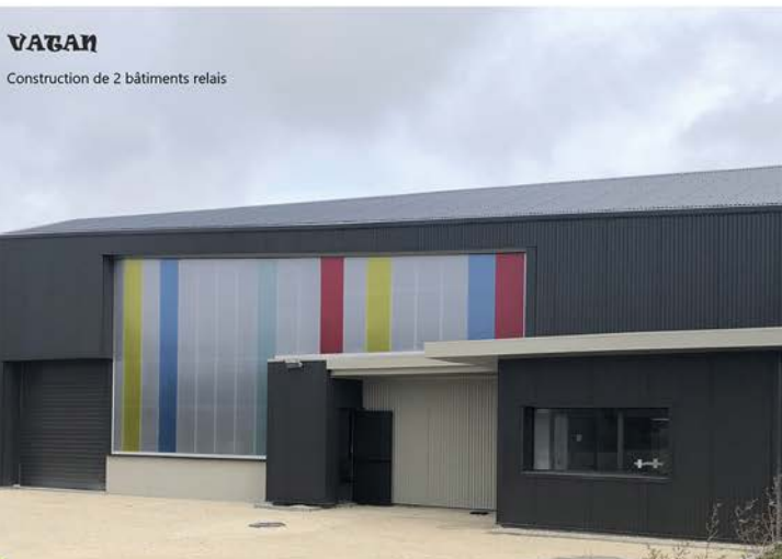
VAGAN Construction de 2 bâtiments relais