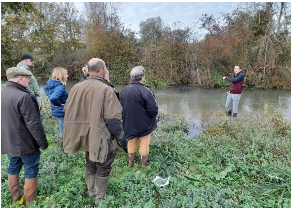
Présentation des travaux d'aménagement de la Théols

Vous pouvez nous contacter pour vous inscrire ou simplement vous informer, après de la Communauté de Communes Champagne-Boischaux, au 02 54 49 77 07