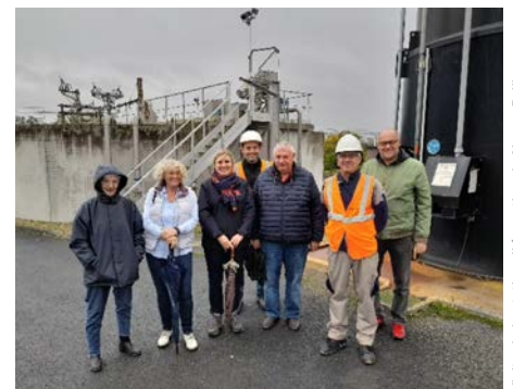
Visite de la station d'épuration de Neuvy Pailloux